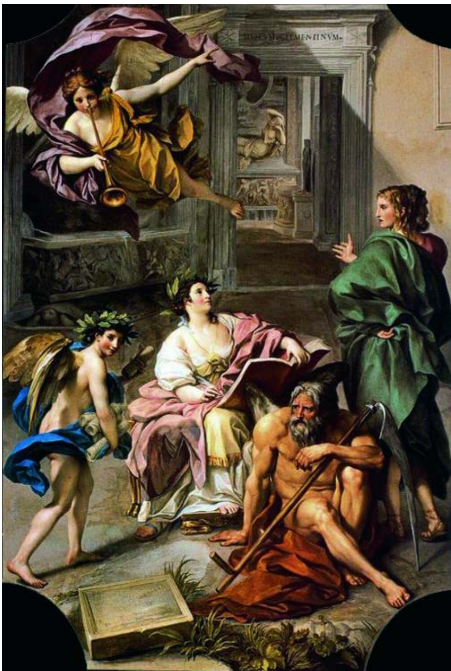
Menga - Allegory of History.