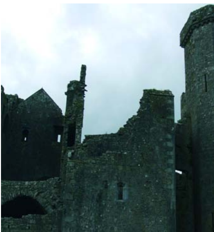
The Rock of Cashel