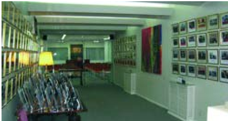
Hall de entrada