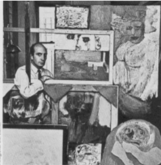
Felipe Noé en su taller de Nueva York en 1964

Ha realizado más de 35 exposiciones individuales en Buenos Aires, Madrid, París, Nueva York, Santiago de Chile, Guayaquil y Bogotá.