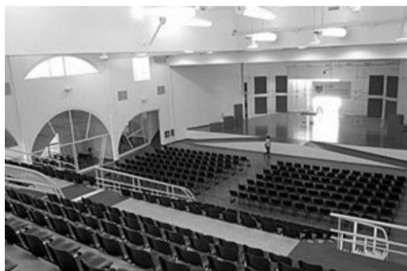
Arq. Clorindo Testa

El Auditorium fue pensado por el autor de modo tal que pudiera contener espectáculos culturales diversos: teatro, danza, recitales de música, actividades deportivas, entre otros usos posibles, que estarán abiertos al público en general. Para permitir esta flexibilidad, el edificio se