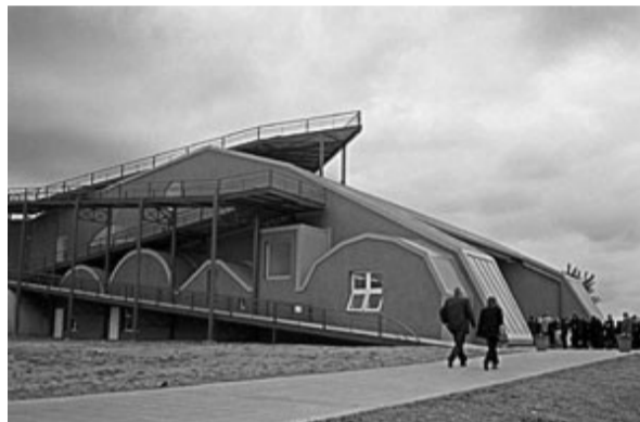
Arq. Clorindo Testa

En lo que respecta a avances edilicios, comenzó a concretarse un proyecto de obras que cuando se ideó previó la construcción de un Auditorium, biblioteca, nuevas aulas, residencias para alumnos y profesores, clínicas universitarias y un hospital veterinario.